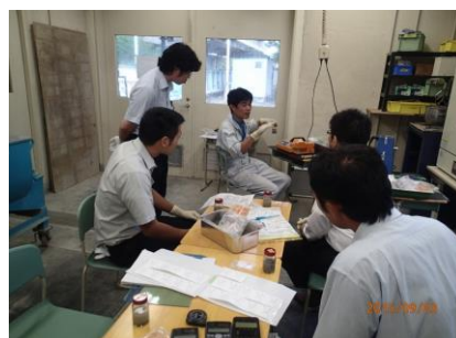
写真－1 土木・建築系実験実習Ⅰの様子

土木・建築系実験実習Ⅱでは、「3D プリンターを用いた立体地図の製作」技術のしくみー地理情報と新進ものづくりの融合に学ぶーをテーマとして実施した（写真－2）。本実験実習は、国土標高データ等地理情報の利用方法と、3D プリント用データファイルの構成を知り、立体地図の製作技術を構成する要素として学習した。また、3D プリンターの利用・活用方法について考えてもらえるような内容とした。実習の到達目標は下記の通りである。