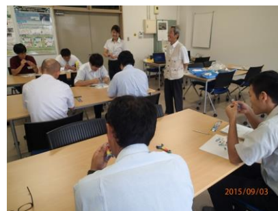
写真－2 土木・建築系実験実習Ⅱの様子