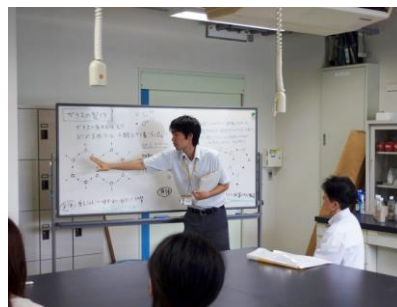
写真-3 物理系実験実習の様子